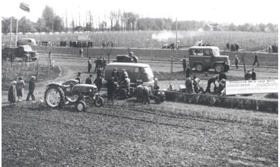
De eerste grote tentoonstelling "Alles voor de fruitteelt".

den de Werktuigendagen Sint-Truiden voor het eerst georganiseerd en deze zijn volgend jaar reeds aan hun 8 ste editie toe.