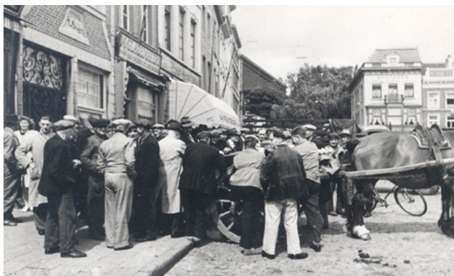
Vervolgen tijden: fruitverkoop op de Sint-Truidense markt.

De idee van een studiekring op te richten was de vondst van Br. Louis met als doel om oud-studenten, reeds in het arbeidsproces betrokken, te laten kennis opdoen over de nieuwste ontwikkelingen in de fruitsector. Eigenlijk was hij een verre voorloper van een later gemeen geworden ideeëngoed van her-scholing, bijscholing, deeltijds leren en vrije leergangen. Vandaag noemt dit 'een leven lang leren'. Waar eerst alleen maar oud-leerlingen deel uitmaakten van de Studiekring, kregen vanaf 1949 alle fruittelers de mogelijkheid om lid te worden.