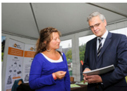
Sofie Vergucht van Phytofar verduidelijkt aan Kris Peeters, Minister-President Vlaamse Regering, hoe het oppervlaktewater kan gevrijwaard blijven van gewasbeschermingsmiddelen.

De fruitrobot "Cäsar" zal vanaf 10 uur rijden in de aanplantingen van de Tuinbouwschool. Als afsluiter van de Wandelvoordracht om 15h30 volgt een demonstratie met info over de werking. ■