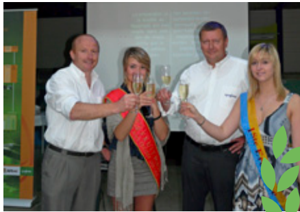
In 2010 was Syngenta met de voorstelling van Affirm ook sponsor van de StuguBBQ.

wordt aan de fruittelers een barbecue aangeboden aan €10 per persoon. Voor meer info en inschrijvingsmogelijkheden zie pagina 38 van dit nummer.