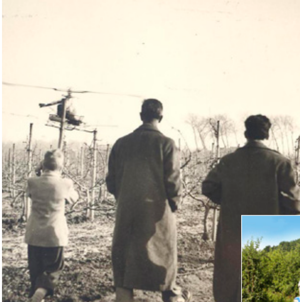
Reeds in 1959 werden bespuitingen met een helikopter uitgevoerd.

Na twee jaar wetenschappelijk onderzoek voor het project 'Weg met de Wolk'